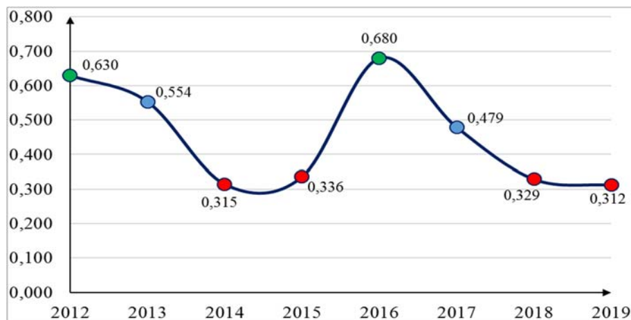
Рис.1. Динаміка інтегральних показників електродвигуна АІР 80

За проведеними попередніми розрахунками в рамках роботи було побудовано графоаналітичну модель розрахованих інтегральних показників ефективності електродвигуна моделі АІР 80 ПАТ «Харківський електротехнічний завод «Укрелектромаш» за останні 8 років, що наведена на рис.1. Модель дозволяє наглядно відслідковувати динаміку інтегральних показників ефективності електродвигунів на стадії занепаду.