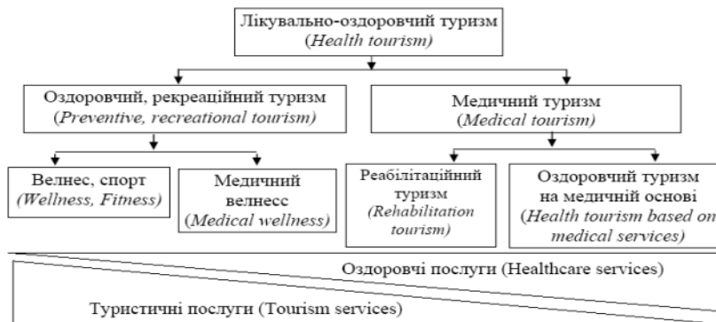
Рис.1. Концептуальна система лікувально–оздоровчого туризму та місце в ній оздоровчої складової [3]

організації подорожі з метою лікування та оздоровлення стали основою міжнародних туристичних обмінів, а питома вага туристів, що подорожують з метою « leisure, recreation and holiday » складає близько 56% або 784 млн осіб щорічно (дані UNWTO за 2018 р., а « health treatment » разом з відвідуваннями родичів та друзів, паломницькими чи релігійними подорожами займає біля 27% усіх відвідувань. Концептуальною системою для лікувально-оздоровчого туризму стали виокремлення потреб туристів у оздоровленні та медичних послуг (рис.1).