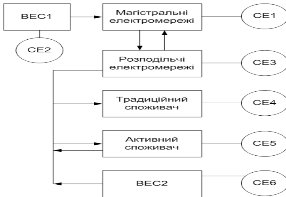
ВЕС – віртуальна електростанція