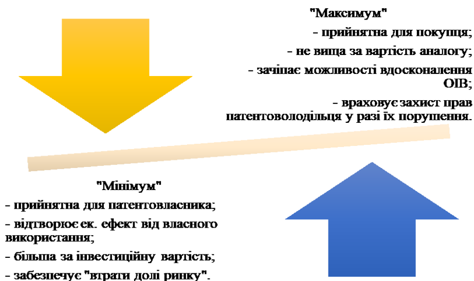
Рис. 1. Визначення ціни на об'єкти інтелектуальної власності по методу "максимум-мінімум"

Визначення обґрунтованою вартості ОІВ базується на двох пунктах: обґрунтована (як з позиції продавця-інноватора, так і з позиції покупця-впроваджувача) вартість повинна забезпечити продавцю відшкодування витрат на створення (розробку) об'єкта інтелектуальної власності, а покупцю отримання вигоди (прибутку) від придбання прав на використання цього об'єкту. Згідно з таким підходом та визначеною нерівністю, вартість ОІВ буде представлена як: