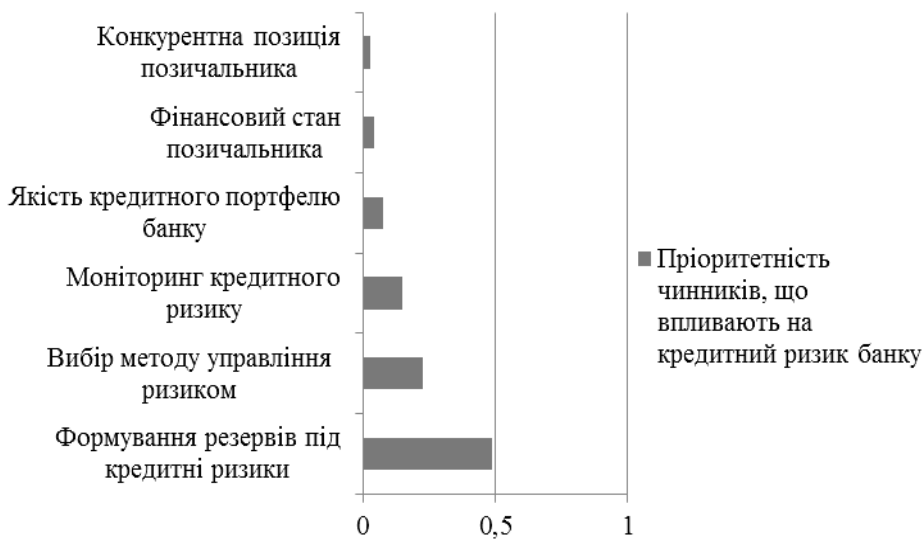
Рис. 2. Вектори пріоритету аналізованих чинників

На рис. 2 подано пріоритетність всіх аналізованих чинників, що були отримані на основі експертних оцінок, за допомогою методу аналізу ієрархій та програми MPriority 1.0.