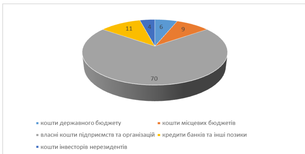
Рис. 2. Структура капітальних інвестицій за джерелами фінансування (у %) [5].

Так, ця проблема є типовою для багатьох країн, де малі та середні аграрні підприємства мають обмежений доступ до фінансування, зокрема іноземного. Одним із ключових факторів, що впливає на це, є низька доходність та конкурентоспроможність сільськогосподарського сектору в таких країнах, включаючи Україну.