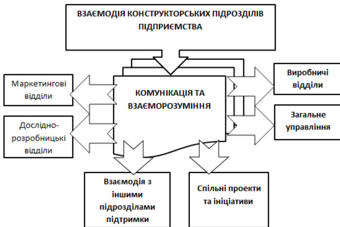
Рис.1.- Напрями взаємодії конструкторських підрозділів з відділами підприємства.

вирішувати конфліктні ситуації та досягати компромісів. Розглянемо основні напрями такої взаємодії та з якими відділами здійснюється така взаємодія. (рис.1).