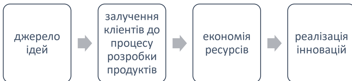
Рисунок 1 – Роль краудсорсингу у створенні інновацій.

ресурси, розширити базу знань і пришвидшити реалізацію інноваційних проектів. Таким чином, роль краудсорсингу у створенні інновацій можна представити наступним процесом рис. 1: