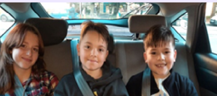
Ці діти - ВІДМІННИКИ в школі і в гуртках

На допомогу активу Регіональних Громад України.