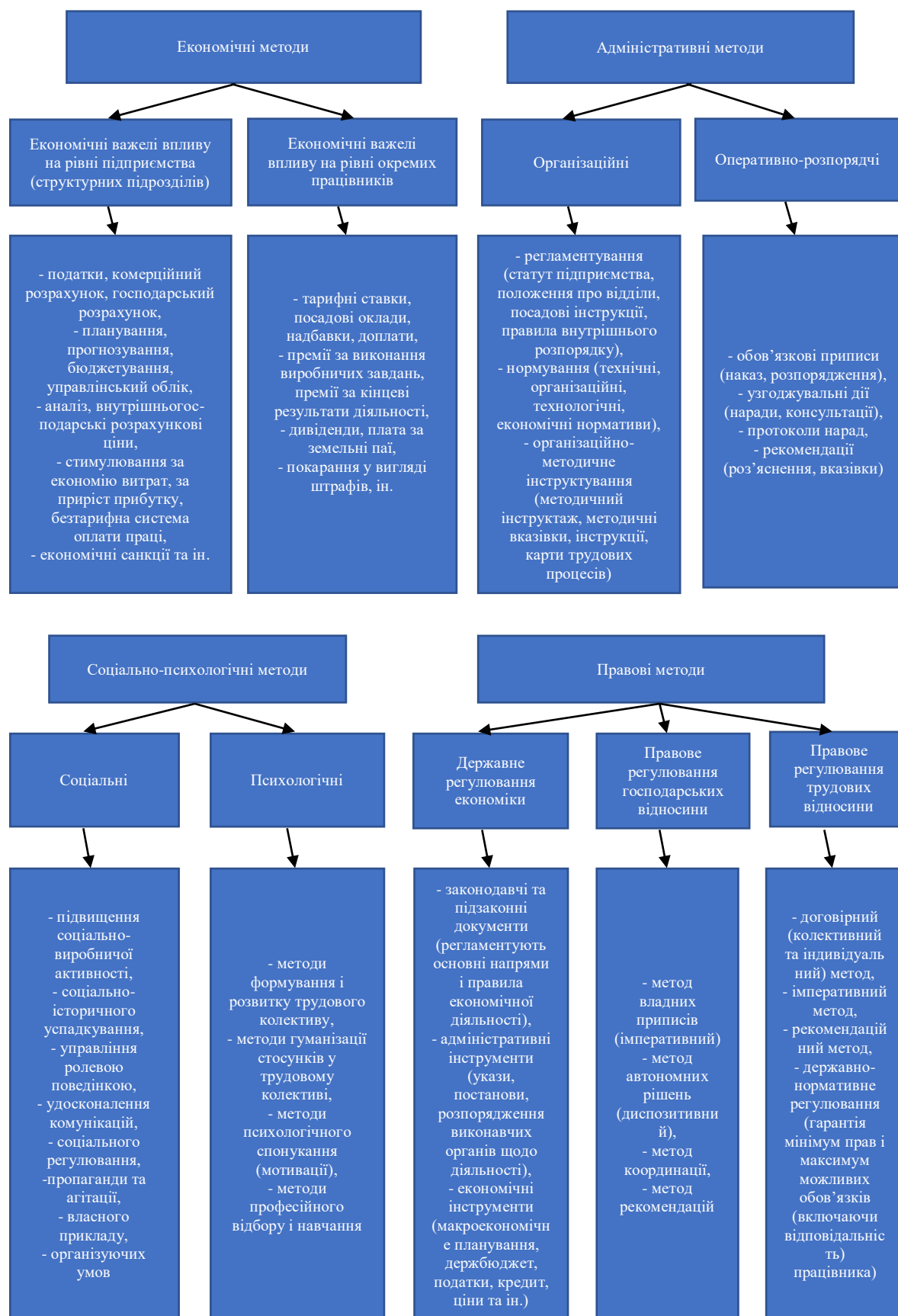
Рисунок 1 – Економічні, соціально-психологічні, адміністративні та правові методи в управлінні підприємством*

виділити такі методи впливу суб'єкта управління на об'єкт управління: економічні; соціально-психологічні; адміністративні; правові (рис. 1).