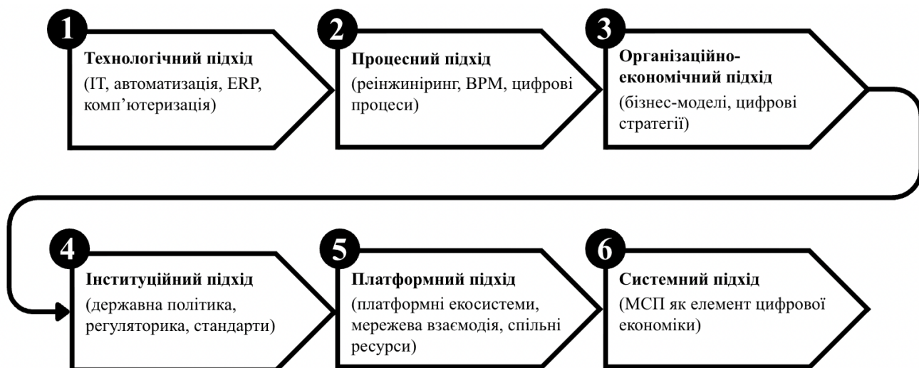
Рисунок 1 – Теоретичний генезис використання наукових підходів у дослідженні діджиталізації МСП.

Як видно з рис. 1, трансформація наукових поглядів відбувалася через шість основних етапів: від початкового технологічного підходу до процесного та організаційного.